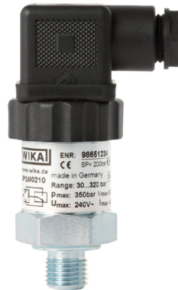
Pressostat compact OEM avec écart (hystérésis) réglable, type PSM02

La haute reproductibilité du point de commutation de \pm 2\% et le caractère réglable de l'hystérésis font du pressostat type PSM02 un produit intéressant pour les utilisateurs qui mettent l'accent sur la précision ainsi que sur un prix avantageux.